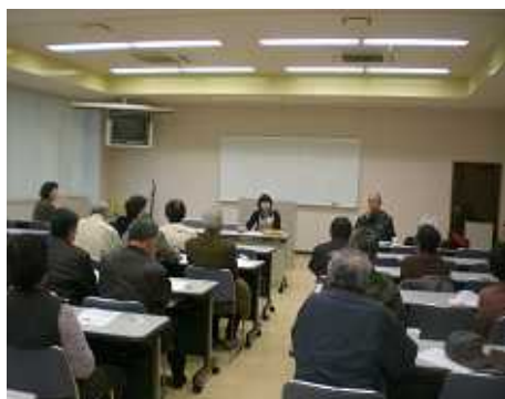
切花栽培部会の様子

平成20年度のふれあい市場の売上は昨年対比109.8%になり、わかば店、ついで店の売上げの大きな力となっています。