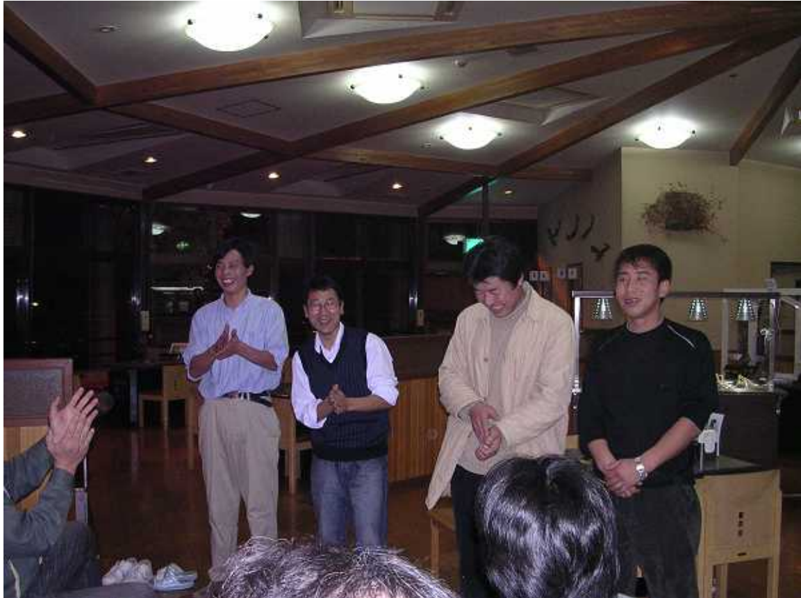
2/9 研修生送別会の様子